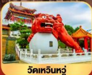
วัดเหวินหลู่