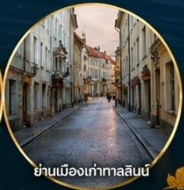
ย่านเมืองเก่าทาลลินน์