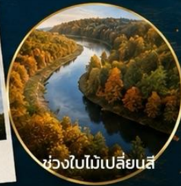
ช่วงใบไม้เปลี่ยนสี