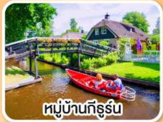
หมู่บ้านทีร์รูม