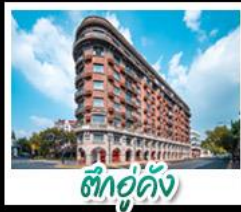
ตึกอู่คิง

หอไข่มุก - เทาหิวไฉ่ซาน - วัดพระใหญ่หลิงซานต้าฝอ เรือสำราญ LOUIS VUITTON LV - ตึกอู่คิง รถไฟลึกลับหมู่บ้านเหยาหู - หมู่บ้านเหมียนฮวงวาน