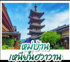
หมู่บ้านเหมียนฮวงวาน