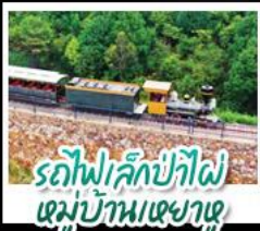
รถไฟลึกลับที่หมู่บ้านเหมียนฮวงวาน