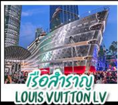
เรือสำราญ LOUIS VUITTON LV