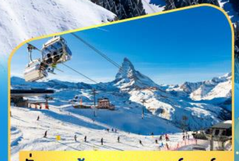
นั่งกระเช้าชมแมทเทอร์ฮอร์น