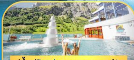
แช่น้ำแร่ร้อนผ่อนคลายคอร์มัท