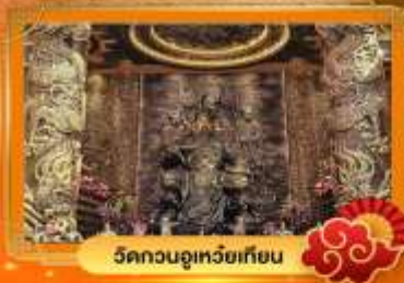
วัดกวนอู๋เหยี่ยวเทียน