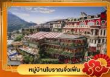
หมู่บ้านโบราณจ่งเฟิน