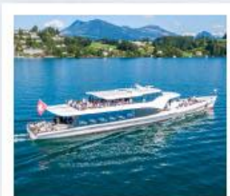
ล่องเรือทะเลสาบลูซิิร์น