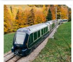
รถไฟโกลด์นพาส