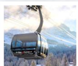
ขึ้นกระเช้ายอดเขาจุงเฟรา