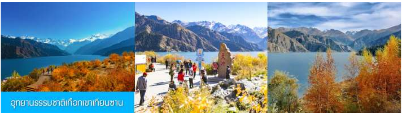
อุทยานธรรมชาติเทือกเขาเทียนชาน

เช้า รับประทานอาหารเช้า ณ ห้องอาหารของโรงแรม (7)