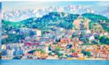
หมู่บ้านชาวประมงชาจื่อไชว