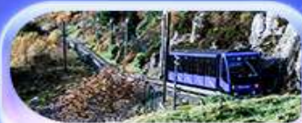
นั่งรถรางขึ้นยอดเขาฟลอยอน

เปิดประสบการณ์สุดว้าว... สักครั้งในชีวิต! ล่องเรือชมฟยอร์ด