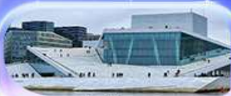
โอเปร่าเฮาส์

07-15 ต.ค.69 / 16-24 ต.ค.69 13-21 พ.ย. 69 / 04-12 ธ.ค. 69 25 ธ.ค. 69 - 02 ม.ค. 70 (ปีใหม่)