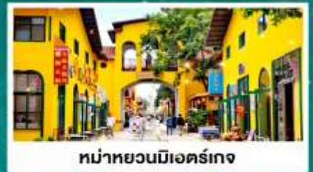
หมู่บ้านมื่อเอ๋อร์เกง