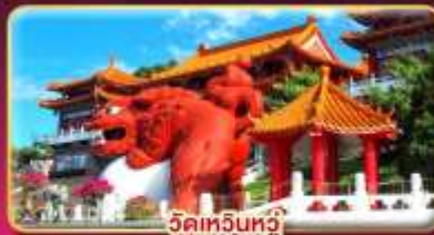
วัดหัวหนิว