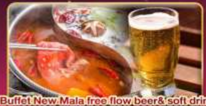
Buffet New Mala free flow beer & soft drink