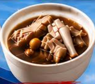
บะกุตเต้