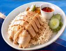
ข้าวมันไก่ปีนัง