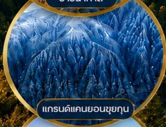
แกรนด์แคนยอนซุยกุณ