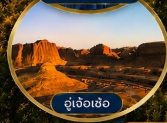
อู๋เจ้อเซ้อ