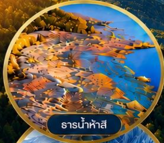
ธารน้ำห้ำสี่