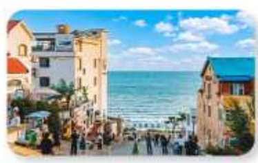
ถนนคนเดินเฟิงสายที่แปด