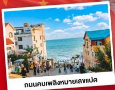
ถนนคอปเปลิงหมายเลขแปด