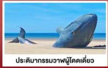
ประติมากรรมวาฬผู้โดดเดี่ยว