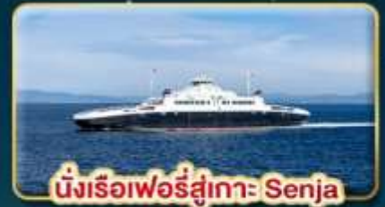
นั่งเรือเฟอร์รี่สู่เกาะ Senja