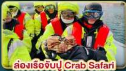
ล่องเรือจับปู Crab Safari

เดินทาง: 08-16 ต.ค. | 07-15 พ.ย. 30 พ.ย. - 08 ธ.ค. 69