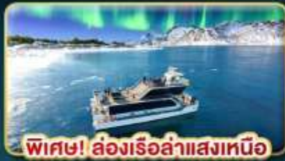
พิเศษ! ล่องเรือลำแสงเหนือ