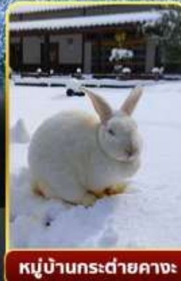
หมู่บ้านกระด่ายคางะ