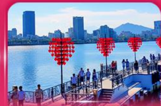
สะพานแห่งความรัก