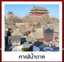
คาเฟ่ น้ำตาล