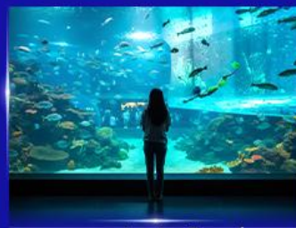
อควาเรียมยักษ์รูปเต่า