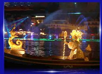
ชมโชว์เวนิสจำลอง แกรนด์วิลด์