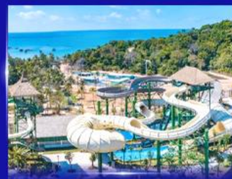
สวนสนุก Sun world Hon thom