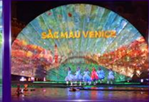
Sac Mau Venice Show