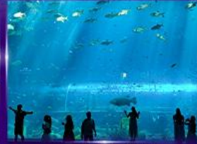
อควาเรียมยักษ์รูปเต่า