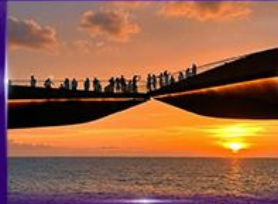
สะพานจูบ Sunset Town