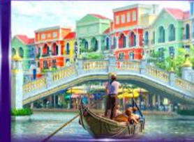
เวนิสจำลอง แกรนด์ เวิลด์