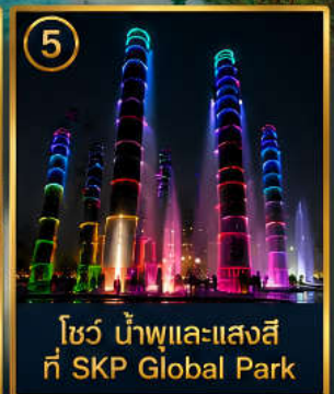
5 โชว์ น้ำพุและแสงสี ที่ SKP Global Park