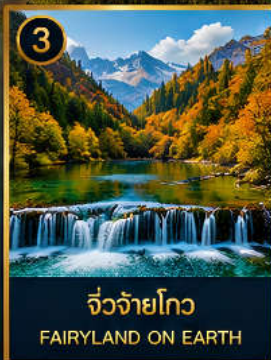
3 จิวจ้ายโกว FAIRYLAND ON EARTH