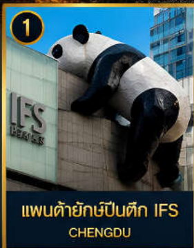
1 แพนด้ายักษ์ป็นตึก IFS CHENGDU