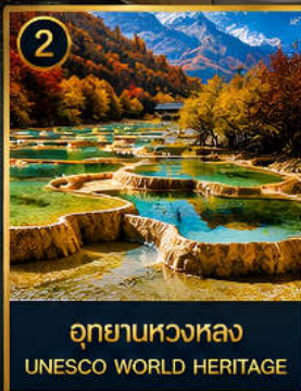
2 อุทยานหวงหลง UNESCO WORLD HERITAGE