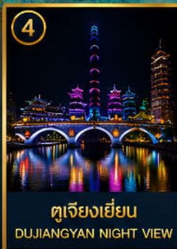
4 ตูเจียงเยียน DUJIANGYAN NIGHT VIEW