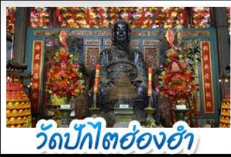
วัดบิกิตฮองฮ่า