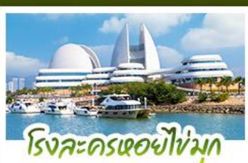
โรงละครเซอซิงมุก