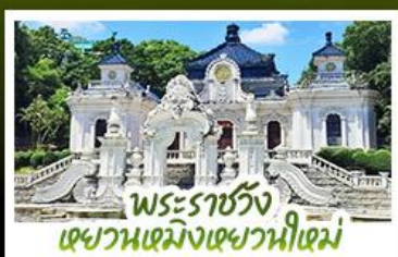
พระราชวัง เฉวานเหมิงเฉวานีเหมิง