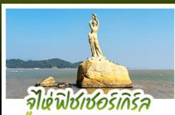
จูไห่ฟิชเชอร์รี่เกิร์ล