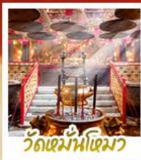
วัดมื่นไทมว