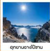
อุทยานดางโป่ซาน