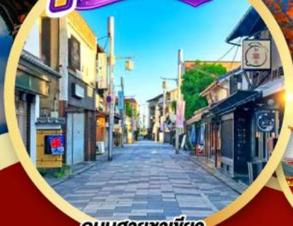
ถนนสายซาเซโบะ