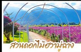
สวนดอกไม้ฮาม่ามูฉาง