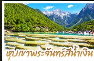
เขื่อนเขาพระจันทร์สีน้ำเงิน