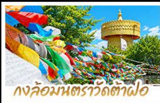
วงล้อมนตราวัดต้าฟอ

ถ่ายรูป MOOD ที่ใช้กับวิวทะเลสาบเอ๋อร์ไห่สุดโรแมนติก • ชมดอกไม้ตามฤดูกาลกลางขุนเขา ณ สวนอวาลูอวอง พิศดูภูเขาหิมะมังกรหยกความสูงกว่า 4,506 เมตร (รวมกระเช้าใหญ่ไป-กลับ) • นั่งรถไฟชมวิวภูเขาหิมะมังกรหยก ชนวิญแบบพาโนรามา • เที่ยวเมืองโบราณต้าหลี่ ลี้เจียง แซงกรี่ล่า ซิม ซือป แซง กับวัดมณฑลยูนนานทิเบต ชมธารน้ำขาวไปสู้อยู่ไกล UNSEEN เมืองจิ่งหน่งยูนนาน • วัดลามะซังจ้านหลิน สัมผัสกลิ่นอายอารยธรรมทิเบต ช้อปปิ้งกับล๊อบบี้ยักษ์ที่ใหญ่ที่สุดในจีน • ช้อปปิ้งเพลิน ณ ถนนคนเดินหนานมิงเจียง & POP MART