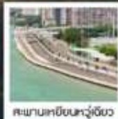
สะพานเหยียนหัวเจียว