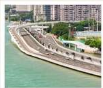
สะพานเหยียนหู่เฉียว