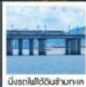
นั่งรถไฟใต้ดินข้ามทะเล