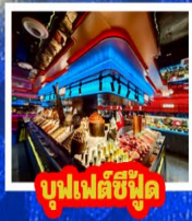
บุฟเฟต์ซีฟู้ด