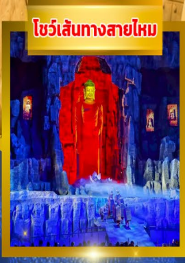
โชว์เส้นทางสายไหม