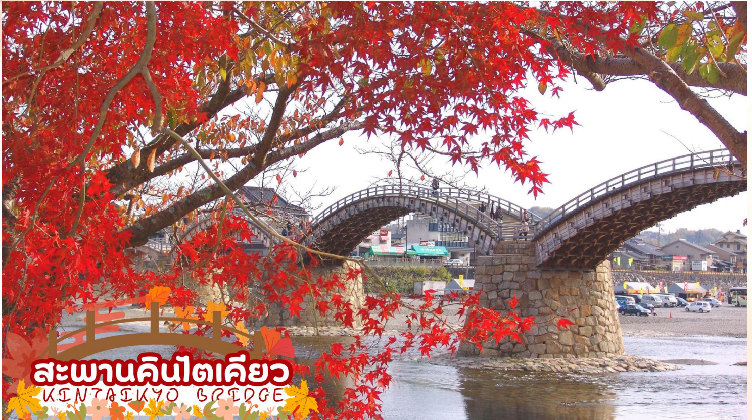
สะพานคินไตเคียว KINTAI KYO BRIDGE

ชมความงามของ สะพานคินไตเคียว (Kintai Kyo Bridge) สะพานไม้ 5 โค้ง 1 ใน 3 สะพานที่สวยงามที่สุดในญี่ปุ่น สร้างครั้งแรกเมื่อปี พ.ศ. 2216 แต่พังทลายลงในปีต่อมา จึงได้มีการสร้างขึ้นใหม่และอยู่มา ยาวนานกว่า 270 ปีจนกระทั่งถึง พ.ศ. 2493 สะพานแห่งนี้ได้พังทลายเพราะถูกพายุไต้ฝุ่นคิโยะพัด ทำลาย ชาวเมืองอิวาคุนิเลยพร้อมใจกันสร้างสะพานขึ้นมาใหม่อีกครั้งตามรูปแบบเดิม (ใบไม้เปลี่ยนสี ขึ้นอยู่กับสภาพอากาศ)