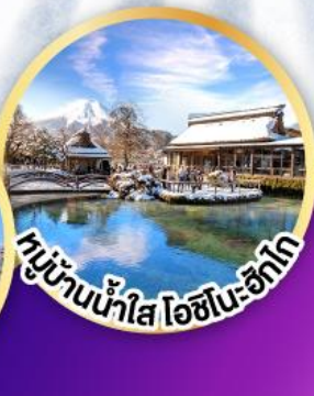
หมู่บ้านน้ำใส ไอชิโนะ-ซึกาโ