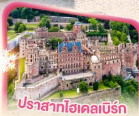
ปราสาทไชลอนเบิร์ก