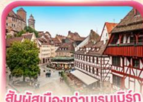
สัมผัสเมืองเก่าบูเรมเบิร์ก