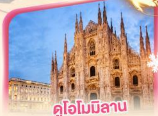
คูโอโมมิลาโน