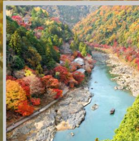
“ARASHIYAMA MT. KAMEYAMA”