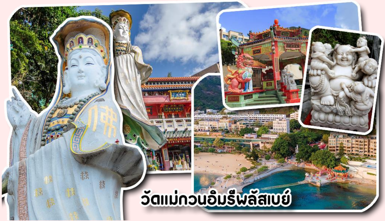
วัดแม่กวนอิมรีพลัสบย์

อยากได้ลูกสาวให้ลู่บ่ท้องขวา ถัดมาคือ เจ้าแม่ทับทิมเทพีแห่งท้องทะเล ท่านจะคอยคุ้มครองผู้เดินทางทางเรือ หรือผู้ที่เดินทางไปไหนมาไหนท่านจะคอยคุ้มครองให้ปลอดภัย และมีโชคลาภ ถัดจากบริเวณที่กราบไหว้ขอพร ก็จะมีศาลาแปดเหลี่ยมริมน้ำ และสะพานเล็กๆ ที่ชื่อว่าสะพานต่ออายุ ซึ่งเชื่อกันว่าหากเดินข้ามสะพานแห่งนี้ 1 ครั้ง ก็จะมีอายุยืนขึ้น 3 ปี