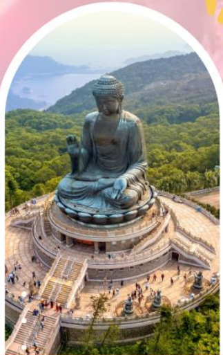
นั่งกระเช้ามองปีง นมัสการพระใหญ่ไป่วหลิน