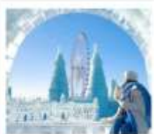
ICE & SNOW FEST.