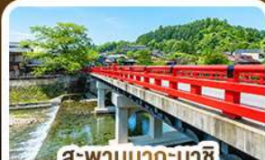
สะพานนากะบาชิ ทาดายาม่า