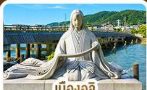
เมืองอจิ สวรรค์คนรักชาเขียว