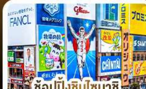
ช้อปปิ้งชินโซบาชิ และโดตงโบริ