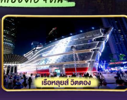
เรือลู่ยี่ วัดตง