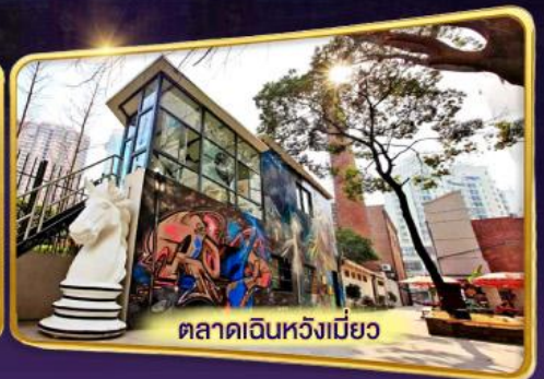
ตลาดเงินหวังเมี่ยว