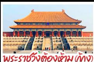
พระราชวังต้องห้าม (ปักกิ่ง)