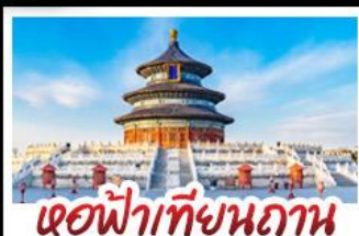
เขื่อนฟ้าเทียนถาน