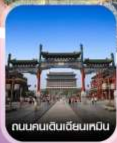
ถนนคนเดินเฉียนเหมิน

✈️ คอนเฟิร์มออกเดินทาง ทุกพีเรียด 2 ท่านขึ้นไป