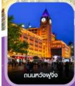
ถนนทวิงฟู่จิ่ง