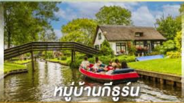
หมู่บ้านทีรูร์น