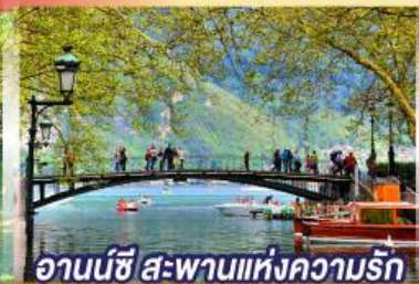
อานนชี สะพานแห่งความรัก