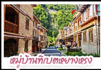
หมู่บ้านทิเบตทางตรง

ตะลุยเจียงคู คูหิมะ-ตำกู่ปิงชวน ชวนเช็กอินแพนด้ายักษ์ พักใจที่หยดน้ำดาสีฟ้า! แวะชิลเมืองโบราณลั่วไต้ สัมผัสลมเต๋อสนั้ท์ หมู่บ้านทิเบตทางทรงฮาต้อ สัมผัสความหนาวเย็นที่ อุกยานสวรรค์ธารน้ำแข็งตำกู่ปิงชวน แหล่งรวมวิวหลักล้าน ตื่นตาไปกับแสงสียามค่ำคั่น หยดน้ำดาสีฟ้า ณ สะพานหนานเฉียว เมืองดูเจียงเยี่ยน ก่อนปิดท้ายด้วยการช้อปปิ้งจุใจ ถนนชุนซู่-ไถ่กู่หลี่ และอะภาทกับ แพนด้าเซลฟี่ สุดคิวท์