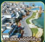
ทะเลสาบเอ้อไห่คัง S