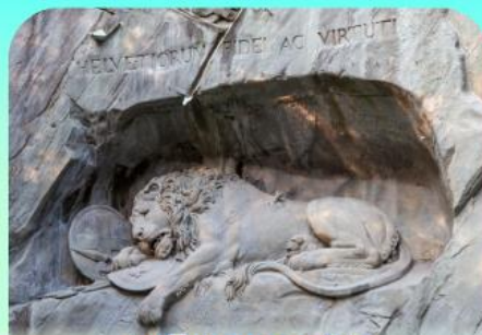
สิงโตหินแกะสลัก