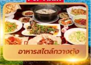
อาหารสไตล์กวางตุ้ง