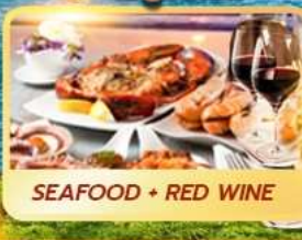
SEAFOOD + RED WINE