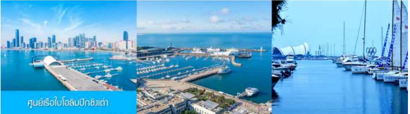
ศูนย์เรือใบโอลิมปิกชิงเต่า

จากนั้นนำท่านเที่ยวชม โรงเบียร์ชิงเต่า 青岛啤酒博物馆 พิพิธภัณฑ์เบียร์ที่ขึ้นชื่อของเมืองชิงเต่า ซึ่งเป็นเบียร์ยี่ห้อแรกที่ผลิตขึ้นในประเทศจีน ชมเบียร์ คอลเลกชันที่มียี่ห้อหลากหลายที่สุดของโลก และชมการจัดแสดงภาพและวิดิทัศน์เกี่ยวกับวิวัฒนาการของเบียร์ ขั้นตอนการผลิตและอื่น ๆ ที่เกี่ยวข้อง พร้อมชิมเบียร์ชิงเต่า ซึ่งเป็นเบียร์ที่ขายดีที่สุดยี่ห้อหนึ่งของจีน.. (ชิมเบียร์ชิงเต่าท่านละ 1 แก้ว รับประทานอีก 1 ขวดเล็ก ตอนเดินออก)