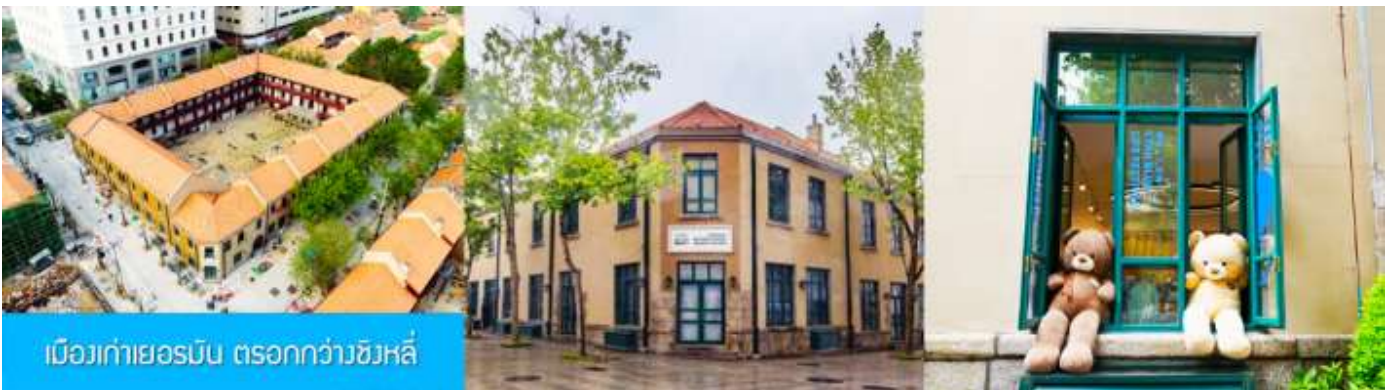
เมืองเก่าเยอรมัน ตรอกกว้างชิงหลี่

จากนั้นนำท่านเดินเที่ยวชม ถนนจงซาน 中山路 ถนนที่เต็มไปด้วยกลิ่นอายยุโรป และถนนสายนี้มีบันทึกรื่องราวมากกว่าศตวรรษของเมืองชิงเต่าไว้ ที่นี่เป็นศูนย์กลางการค้าแห่งแรกที่เต็มไปด้วยสถาปัตยกรรมสไตล์ยุโรปเก่าแก่ที่ได้รับอิทธิพลมาจากเยอรมัน ให้ท่านได้เดินเก็บบรรยากาศ และ เก็บภาพกับโบสถ์เซนต์ไมเคิล (ด้านนอก) โบสถ์แห่งนี้ที่คู่รักนิยมมาถ่ายภาพงานแต่งงานกันมากที่สุดในเมืองชิงเต่า ให้ท่านถ่ายรูปเก็บภาพ