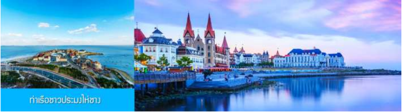
ท่าเรือชาวประมงไห่ซาง