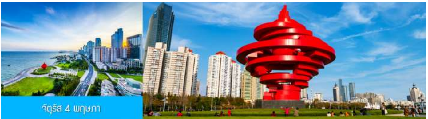
จัตุรัส 4 พฤษภาคม

จากนั้นนำท่านเที่ยวชม ศูนย์เรือใบโอลิมปิกชิงเต่า (Qingdao Olympic Sailing Center) ซึ่งเป็นสถานที่จัดการแข่งขันเรือใบในโอลิมปิกฤดูร้อน 2008 ปัจจุบันเป็นสถานที่ท่องเที่ยวชั้นนำริมทะเลที่สวยงาม มีท่าจอดเรือยอชท์, พื้นที่จัดกิจกรรม, และทิวทัศน์ที่สวยงาม ให้นำท่านเก็บภาพบรรยากาศความสวยงามตามอัธยาศัย