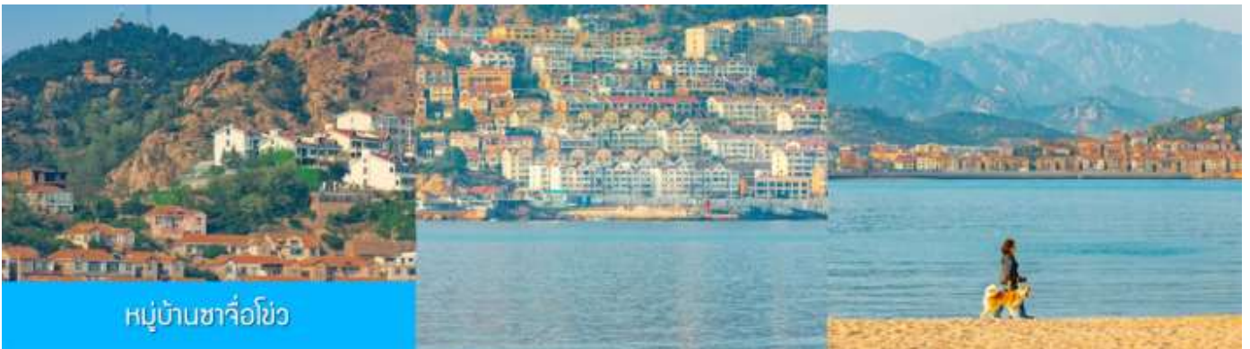
หมู่บ้านซาจื่อโจ้ว

เช้า รับประทานอาหารเช้า ณ ห้องอาหารของโรงแรม (4)