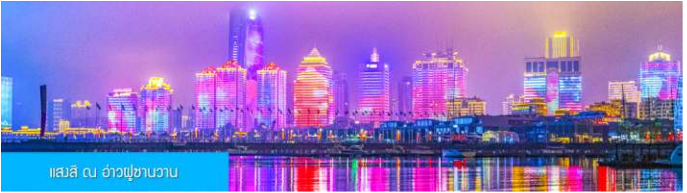
แสงสี ณ อ่าวฟูซานวาน

หลังอาหารนำท่านชมความอลังการของแสงสี ณ อ่าวฟูซานวาน 浮山湾灯光秀 ชมความอลังการของแสงสียามหัวค่ำ และไฟที่เต้นระบำได้บนตึกสูง และเป็นหนึ่งในไนท์วิวที่สวยงามที่สุดแห่งหนึ่งของจีน..... พักที่ JIFENG INTER HOTEL โรงแรมระดับ 4 ดาวท้องถิ่น ในเมืองเมืองชิงเต่า