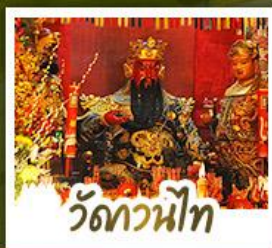
่วดกวนน้ท