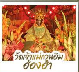
่วดเจ้าแม่กวนอิมอ่องฮ้้า