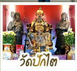
่วดป้กไต่