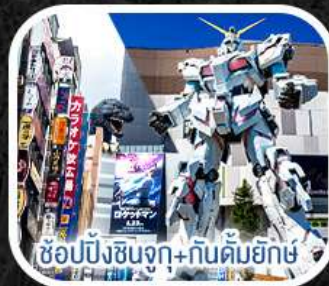
ช้อปปิ้งชินจูกุ+กันดั้มยักษ์